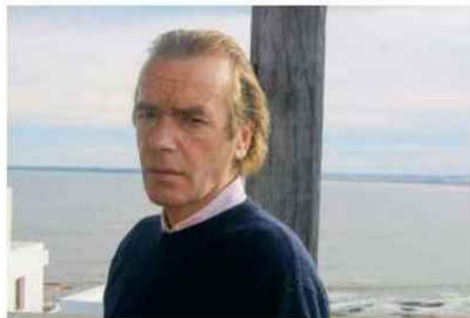
isabel fonsseca / calmann-levy