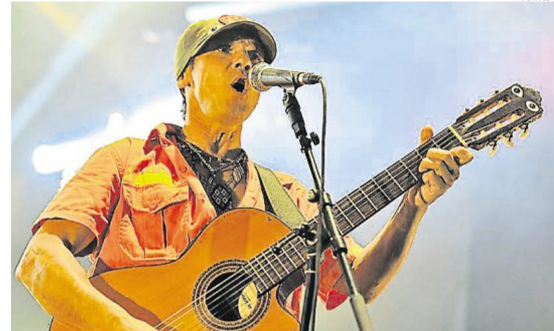
Manu Chao au festival de Poupet en 2012.